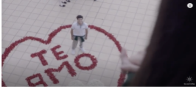
IMAGEN DE PROGRAMA