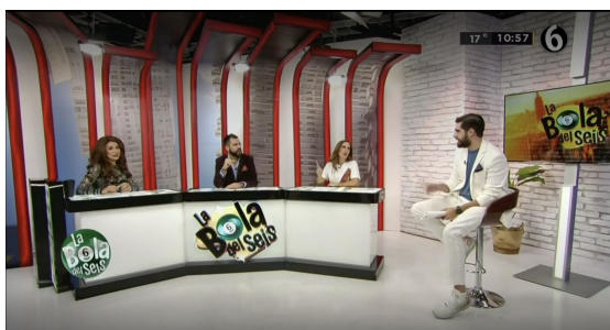
IMAGEN DE LA MUESTRA